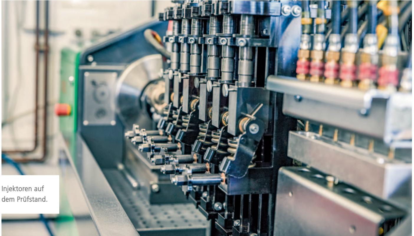
Injektoren auf dem Prüfstand.