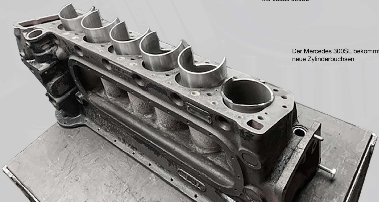
Der Mercedes 300SL bekommt neue Zylinderbuchsen