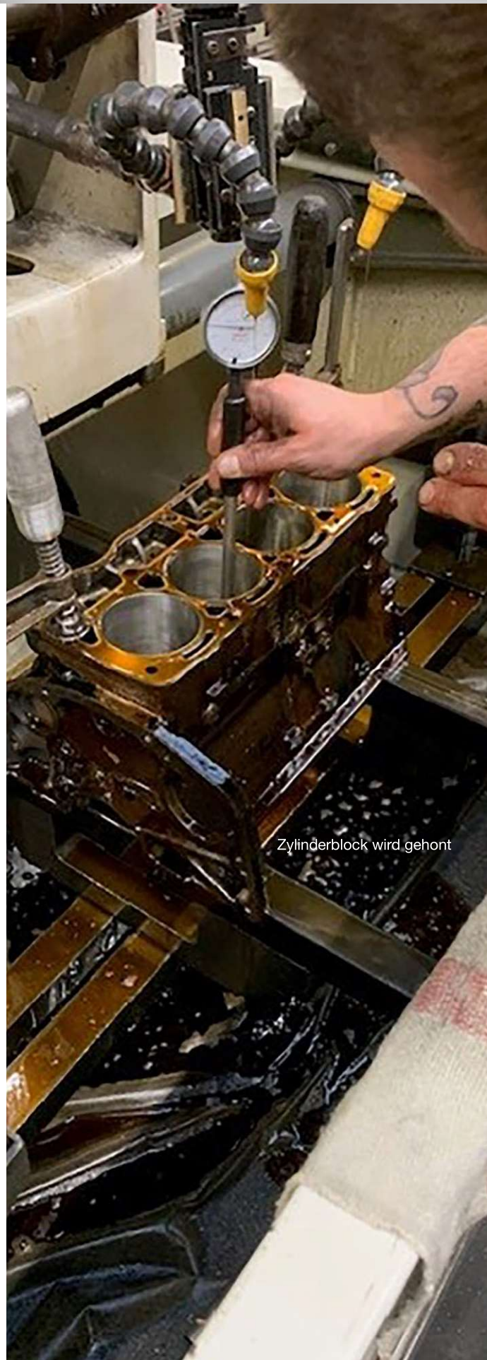
Zylinderblock wird gehont