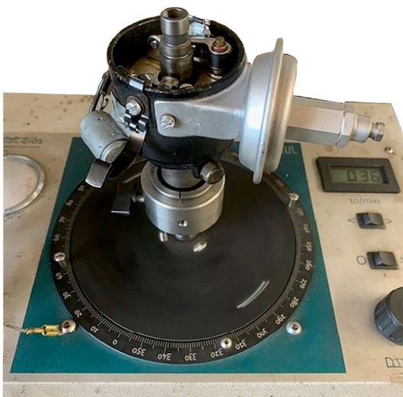
Zündverteiler auf dem Prüfstand

Es ist die Diversität, die in allen Bereichen immer wieder auffällt. Bei den alten Schätzchen und Teilen gilt nicht das bloße Fabrikat, sondern allem voran die markenübergreifende Expertise. Damit dieses Wissen nicht verloren geht sorgt man bei Eckernkamp mit Hilfe regelmäßiger Schulungen, aber auch durch eine intensive Teamarbeit dafür, dass auch die nächste Generation Motoreninstandsetzer lernt, worauf es ankommt und wo die richtige Lösung für ein Problem zu finden ist.