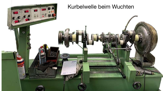
Kurbelwelle beim Wuchten