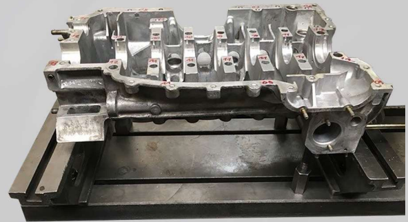
Gehäusebearbeitung eines Porsche 911

Lässt man nun ein wenig den Blick wandern, wird man direkt von den nächsten Spezialfällen gefangen. Unmittelbar in der Nähe werden weitere Arbeitsschritte an Motorblöcken durchgeführt.