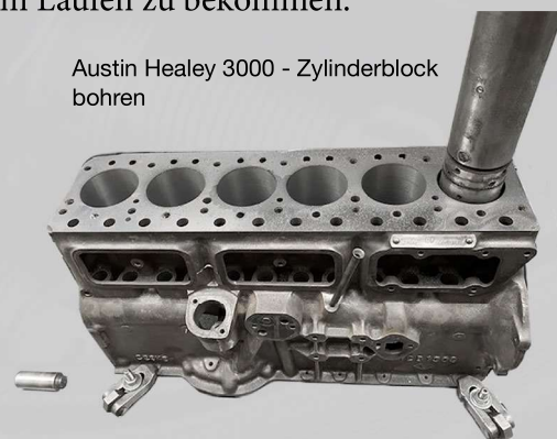
Austin Healey 3000 - Zylinderblock bohren

Auf den ersten flüchtigen Blick lassen sich viele wohlbekannte Maschinen zur Bearbeitung entdecken. Auf dem Bohrwerk befindet sich gerade ein schicker 6-Zylinder Motorblock. Die Besonderheit daran? Das Fabrikat! Der Austin Healey 3000 dürfte selbst für Motor-Enthusiasten ein durchaus seltener Anblick sein. Was diesen Motor zur Herausforderung macht, ist jedoch gar nicht unbedingt die technische Bearbeitung an sich. Es ist viel mehr das, was an Wissen dazu gehört. Welche Maße müssen eingehalten werden, welche Kolben gibt es für den Motor überhaupt noch, und woher bekommt man die Ersatzteile? Genau das ist es, was die Experten der Eckernkamp Classics ausmacht. Die vollumfängliche Betreuung, um den Motor wieder zuverlässig zum Laufen zu bekommen.