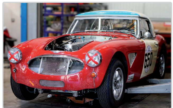
Oben: Auch historische Motorsport-Fahrzeuge sind bei Eckernkamp Classics in guten Händen

Trotz aller Weiterentwicklung und des kontinuierlichen Wachstums bleibt eines unverändert: Eckernkamp ist ein familiengeführtes Unternehmen, das seinen Werten treu geblieben ist. Zuverlässigkeit, Präzision und die Zufriedenheit der Kunden stehen seit jeher im Mittelpunkt des Handelns und bilden das Fundament für den langfristigen Erfolg.