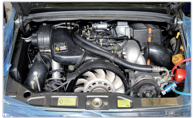
Oben: Ein Porsche 911er-Motor nach der Revision

Auch die räumlichen Voraussetzungen unterstreichen den professionellen Anspruch des Unternehmens. In zwei separaten Hallen stehen rund 600 Quadratmeter Werkstattfläche für die Bearbeitung und Instandsetzung von Fahrzeugen zur Verfügung. Ergänzt wird dies durch eine zusätzliche Halle mit etwa 450 Quadratmetern, die für die sichere Unterstellung von Kundenfahrzeugen genutzt wird. Innerhalb dieses Hallenkomplexes entsteht ein Arbeitsumfeld, das optimale Bedingungen für präzises und hochwertiges Arbeiten bietet.